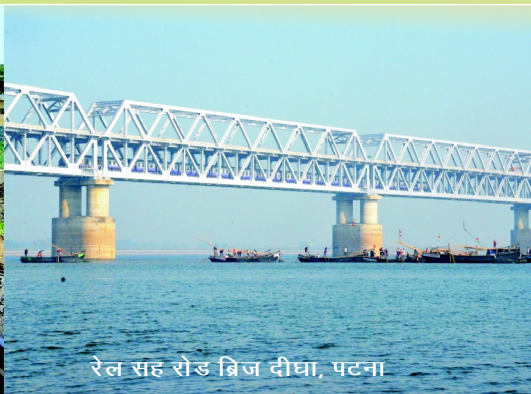
रेल सह रोड ब्रिज दीघा, पटना